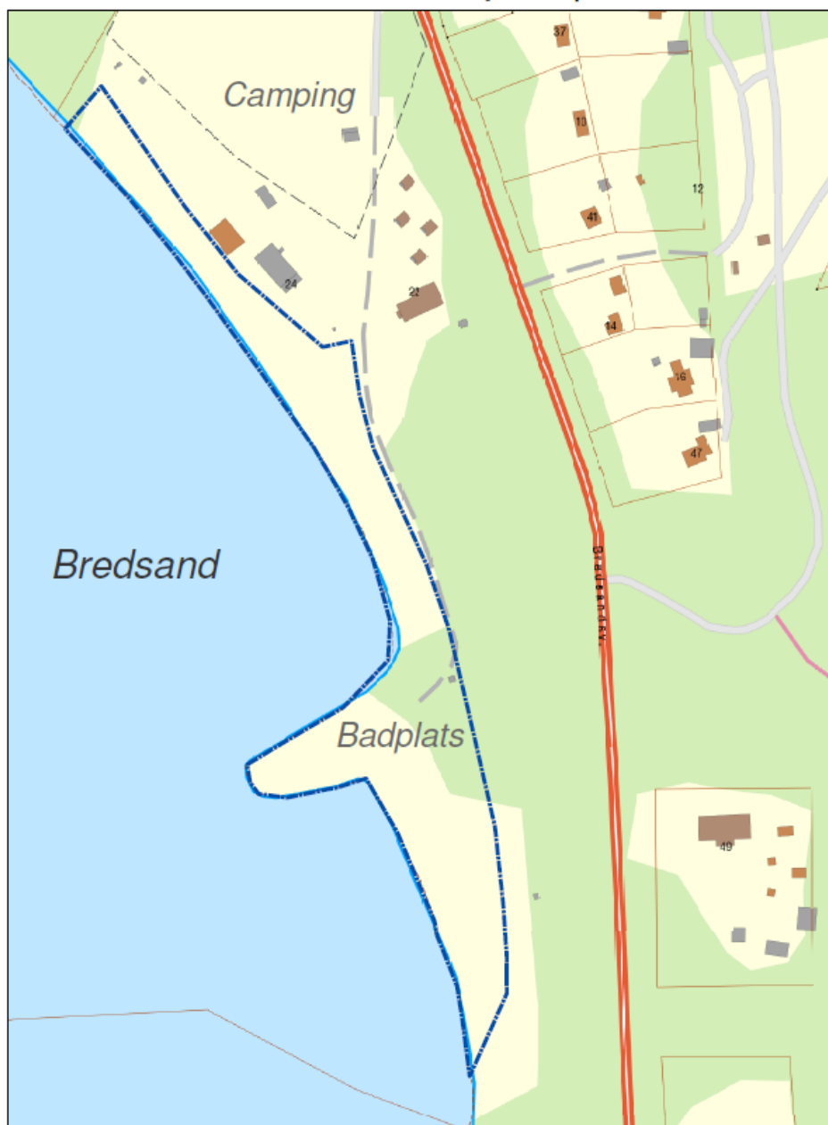
Vistelseförbud för hundar 1 maj - 30 september